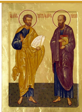
Петров пост: духовный смысл и значение