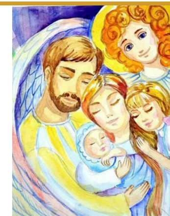
Роль отца в православной семье: Отмечаем День Отца (18 июня)