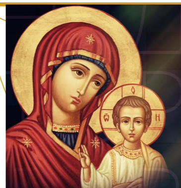
4 ноября Празднование Казанской иконы Божией матери