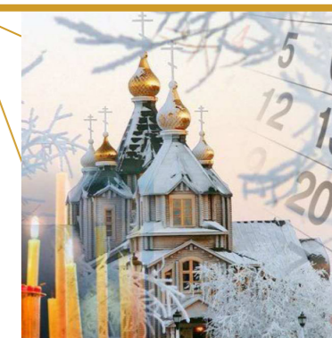
28 ноября Начало рождественского поста