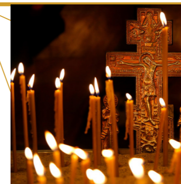
6 ноября Димитровская родительская суббота