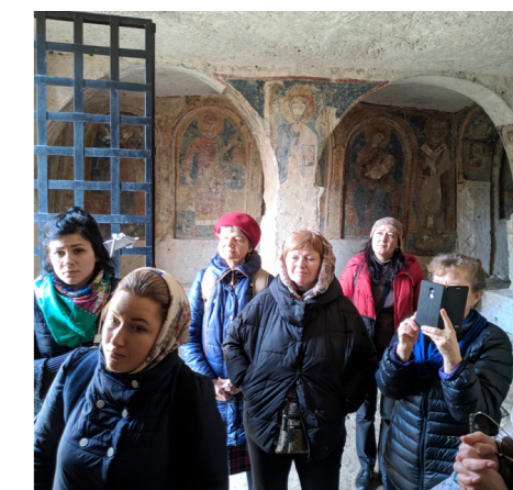
скальная церковь Святителя Николая, г. Мотолла, где молились первые христиане