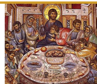
Страстная седмица – путь к Пасхе