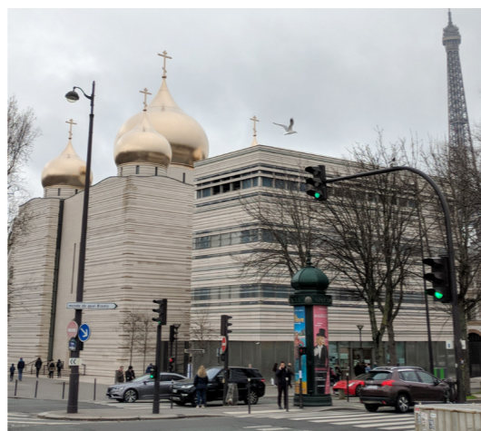
Православный Святоотроцкий храм и русский культурно-исторический центр в Париже, который открылся год назад

«После того, как я узнала про св. великомученицу Екатерину, я отчетливо поняла, мне надо к ней! Не передать словами, что со мной происходило внутри. Как мы ее искали под дождем! Спрашивали у прохожих, и они нам давали надежду, указывая путь. Мне казалось, что я не шла, а бежала к ней. Боялась, что мы ее не найдем! Непрестанно молясь «Святая великомученица Екатерина, моли Бога о нас! Укрепи нас! Помоги найти твой храм». Но у Бога были на нас другие планы, они всегда лучше наших! Благодаря нашему гиду, которая понимала каждого из нас, чувствовала наши переживания, мы попали утром в Храм святой великомученицы Екатерины в Риме. С вечера приготовились ко Святому Причащению, вычитали каноны, приготовились к исповеди. Какие мы были счастливые! После литургии нас пригласили на трапезу.