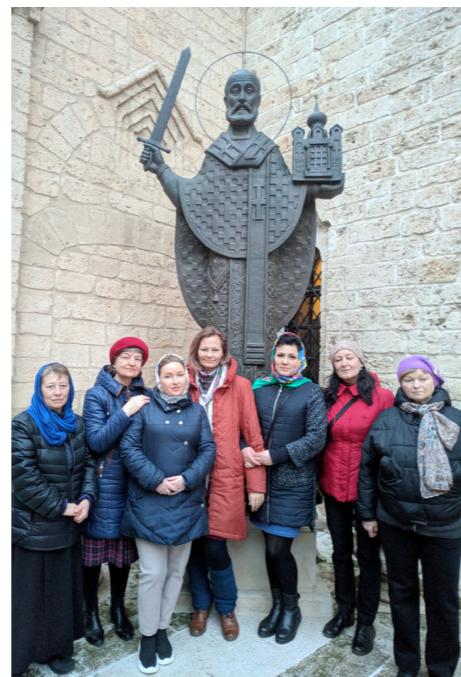
Русское подворье, г. Бари