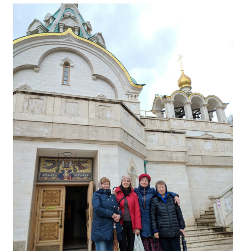
Православный храм св. великомученицы Екатерины, в Риме