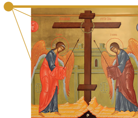
Крест Господень. Неделя Крестопоклонная