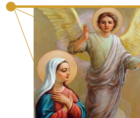
Благовещение Пресвятой Богородицы