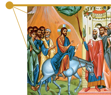
Вход Господень в Иерусалим. Вербное воскресенье