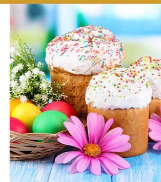
Со Светлым Христовым Воскресением!