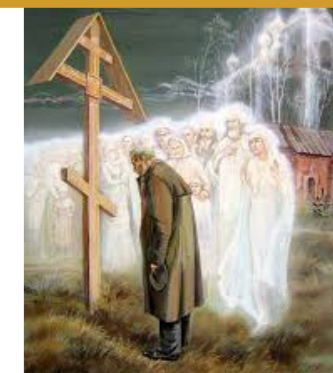
Радоница. Поминовение усопших