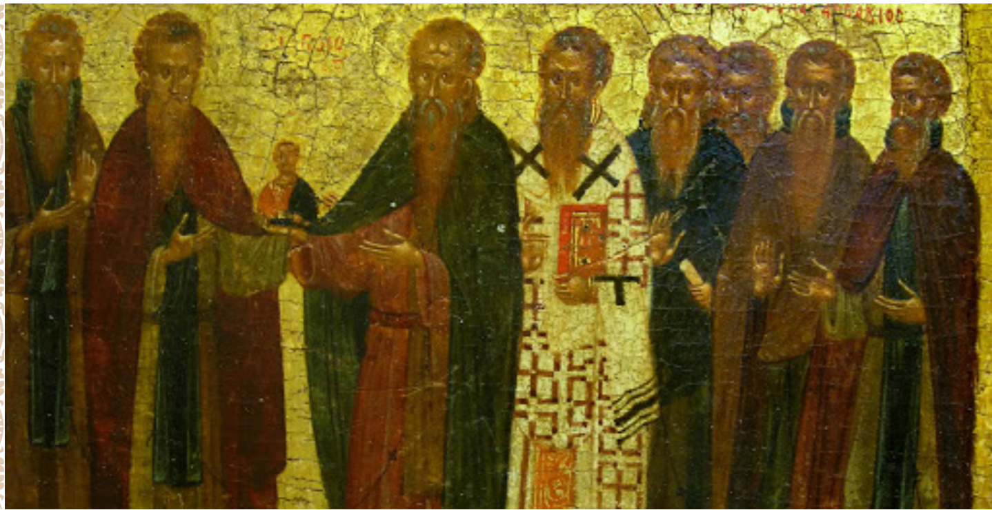
Торжество Православия; XIV в.; Византия. Греция

чуду познания Божия через воплощение Христово, через дар Святого Духа, через малую нашу веру, наше доверие к Богу, нашу тоску по Боге, поскольку мы приобщены к этому, то сегодня мы можем ликовать о том, что Бог в Своей любви, в Своей милости, в Своей ласке столько нам дает познания Себя, и не мозгового, не головного познания, а познания, которое достигает до самых глубин нашей души, нам дает понимать Кто Бог, и нам дает и с другими поделиться хоть тем немногим знанием, которое у нас есть. А иногда то, что мы говорим, достигает другого человека глубже, чем оно достигло нас; мы бросаем семя, которое мы только в руке держим, а оно падает на добрую землю, которая приносит такой плод, о котором мы и мечтать не могли. Поэтому будем ликовать сегодня о том, что Бог и в нас побеждает, что Бог и в нас раскрывает и истину, и жизнь, и любовь, и радость, делает нас новой тварью, но не будем превозноситься над другими. В древности были созданы очень строгие правила о том, чтобы не общаться с еретиками; но те еретики не просто инакомыслящие были; те еретики отрекались от того, что Христос есть Бог воплощенный, они отрекались от того, что Бог, пришедший в мир, воплотился, говорили, что Он был только кажущимся человеческим присутствием, они уничтожали нашу веру в воплощение и в спасение, в крест и воскресение. Да, с теми православными молиться было невозможно; нельзя было делить веру, надежду свою с ними.