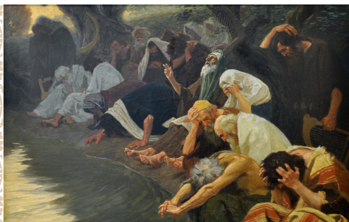
Гехард Фугель «На реках Вавилонских»

салима вавилонянами, когда иудеи радовались этому национальному бедствию.