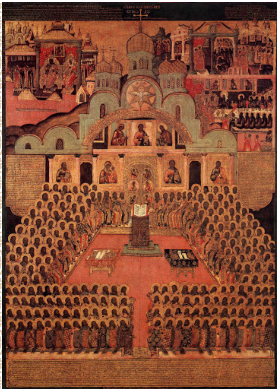
Седьмой Вселенский Собор в г. Никее на который явились 367 отцов

императора Феофила, прежде яростного иконоборца. На двенадцатом году правления он сильно заболел. Как-то Феодора услышала вопль императора: «Горе мне, несчастному: подвергаюсь побоям за святые иконы!» Несмотря на запрет, императрица тайно хранила в своей спальне несколько икон. Услышав крики мужа, она с молитвой возложила на больного образ Богородицы. Император поцеловал святой образ, и ему стало легче. Вскоре он умер.