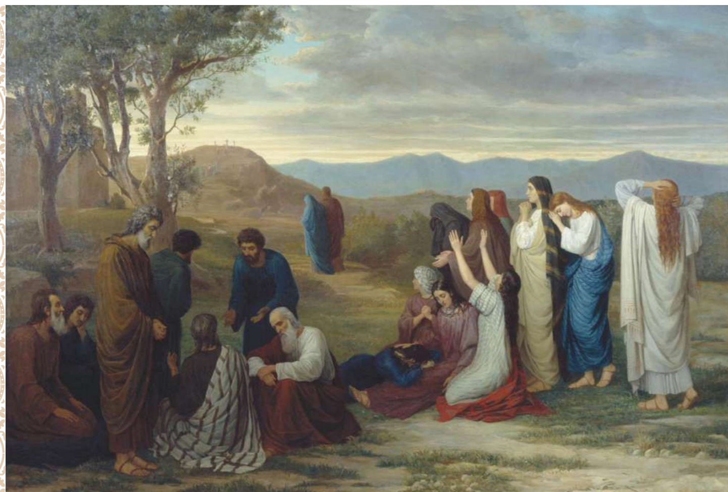
Картина Михаила Боткина «Плач иудеев на реках Вавилонских»

Ну вот, братья и сестры, вступили мы на поприще нового Великого Поста. Церковь заблаговременно готовит нас, молитвами и притчами настраивает души на покаяние. Одну из покаянных молитв, песнопение «На реках Вавилонских» (136 псалом), мы слышали с недели о блудном сыне (вторая подготовительная неделя перед Великим постом) и две последующие недели до недели о Страшном суде. Звучал псалом 136 в субботу вечером на центральной части Всеношного бдения (полиелее) после хвалебных псалмов. Великий Пост начался, мы слышим другие молитвы, покаянный канон Андрея Критского, молитву Ефрема Сирина, но хочется вернуться немного назад, туда, откуда мы начали плакать, на Вавилонские реки.