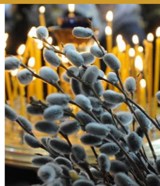
Вход Господень с Иерусалим. Вербное воскресенье